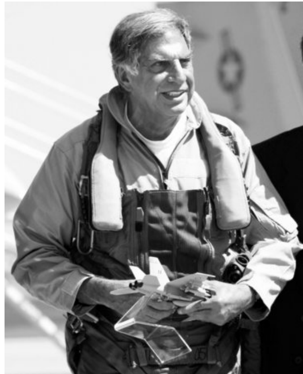
Ratan Tata after flying the US F-18 aircraft as a co-pilot during the Aero India 2007 air show in Bengaluru

Even Cvrus Mistry, who succeeded Ratan Tata as the chairman but was later ousted, October 2016 letter that his