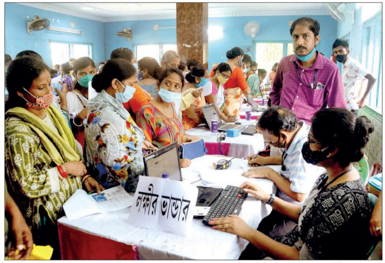
দুয়ারে সরকার ক্যাম্পে লক্ষ্মীর ভাণ্ডারের আবেনপত্র সংগ্রহ করছেন মহিলারা। সোমবার।