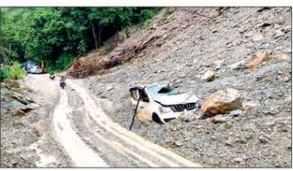
সিকিমে ধস-বিধুস্ত গাড়ি।