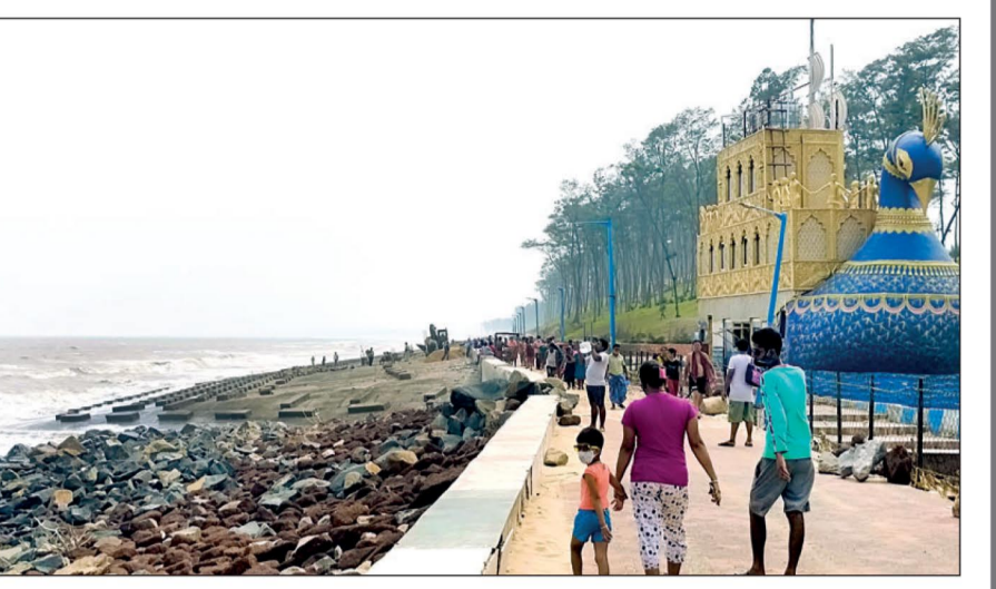
পর্যটকদের আনাগোনা যীরে যীরে কোলাহলপূর্ণ হয়ে উঠছে দিঘা।